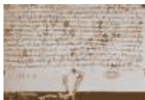
Morgengave brevet 1229