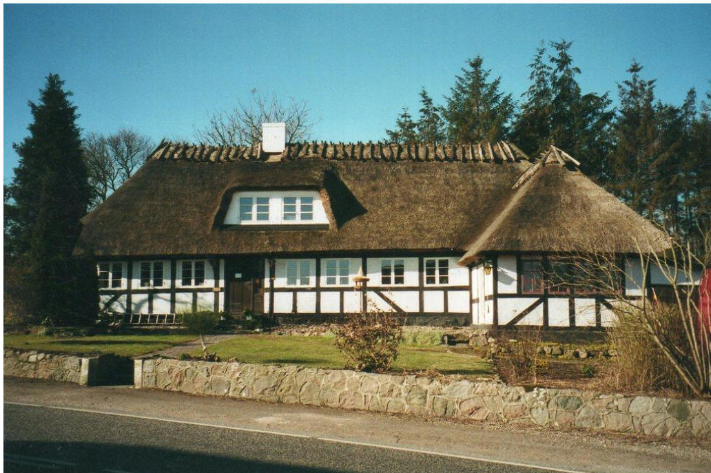
DET VAR VINDUET NÆRMEST GANGDØREN, HVOR SKUDET RAMTE. FOTO: AASTRUP FOLKEMINDESAMLING

Jens Haastrup, Aastrup Folkemindesamling